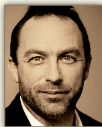
Mr. Jimmy Wales Founder, Wikipedia USA