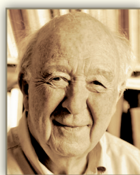
Prof. Peter R. Brown Historian Princeton University USA

Retrieving the Past: Historians and Their Sources